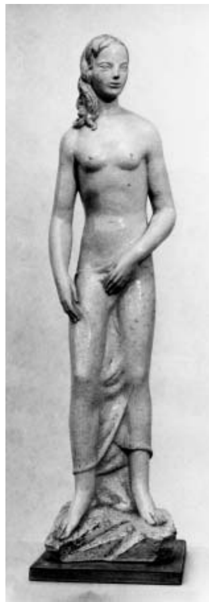
Jozo Turkalj, Ženski akt 1927.