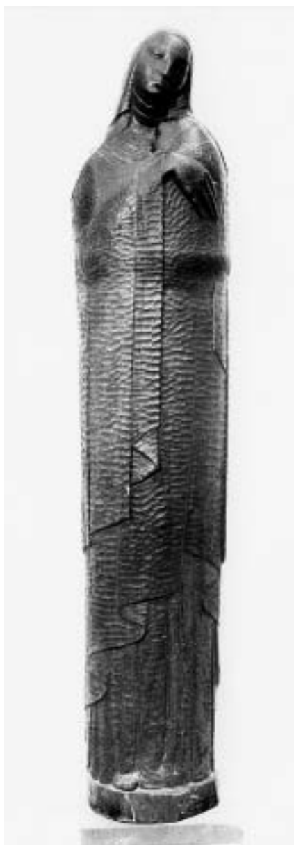
Vojta Braniš, Madona , 1920.