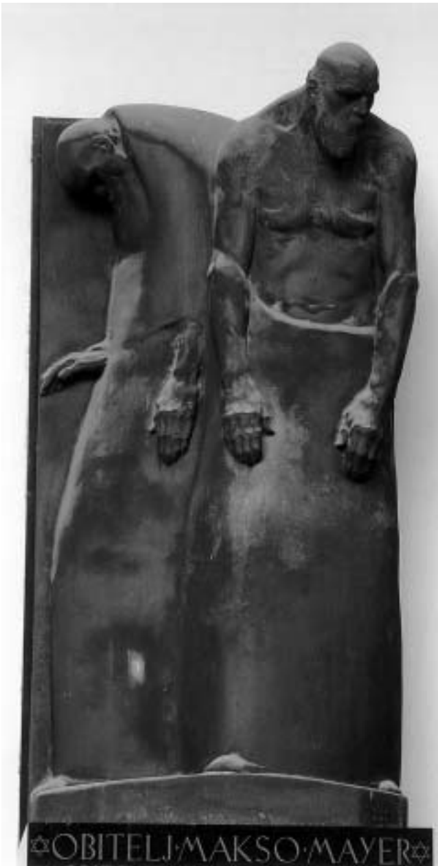
Robert Frangeš Mihanović, Dva stara oca, 1924.