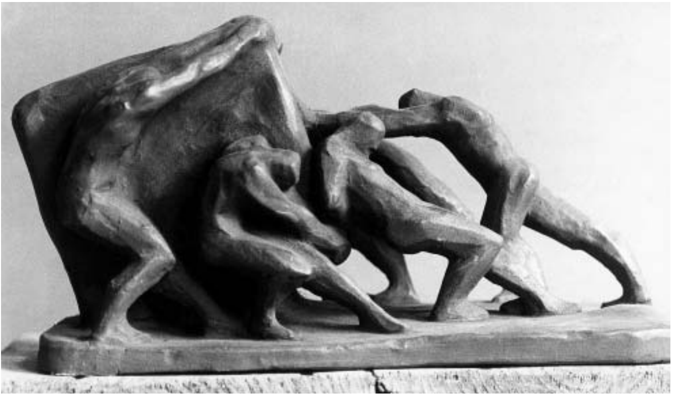
Robert Jean Ivanović, Ciklus Rad , skica 1916.