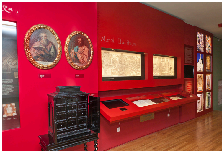
Slika 2 Arhitektonsko- kiparski studio Katedrale svetog Jakova