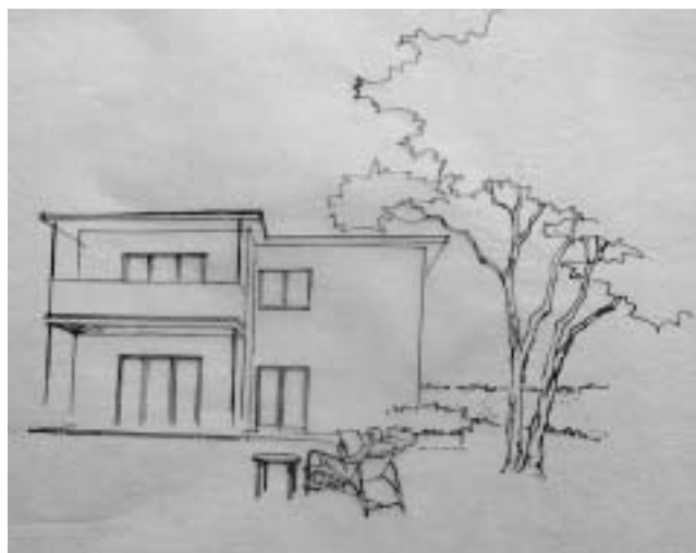
Obiteljska kuća Slavić, perspektiva, inv. br. MGZ 8253.