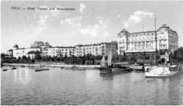
Hotel Riviera i Ville Münz.