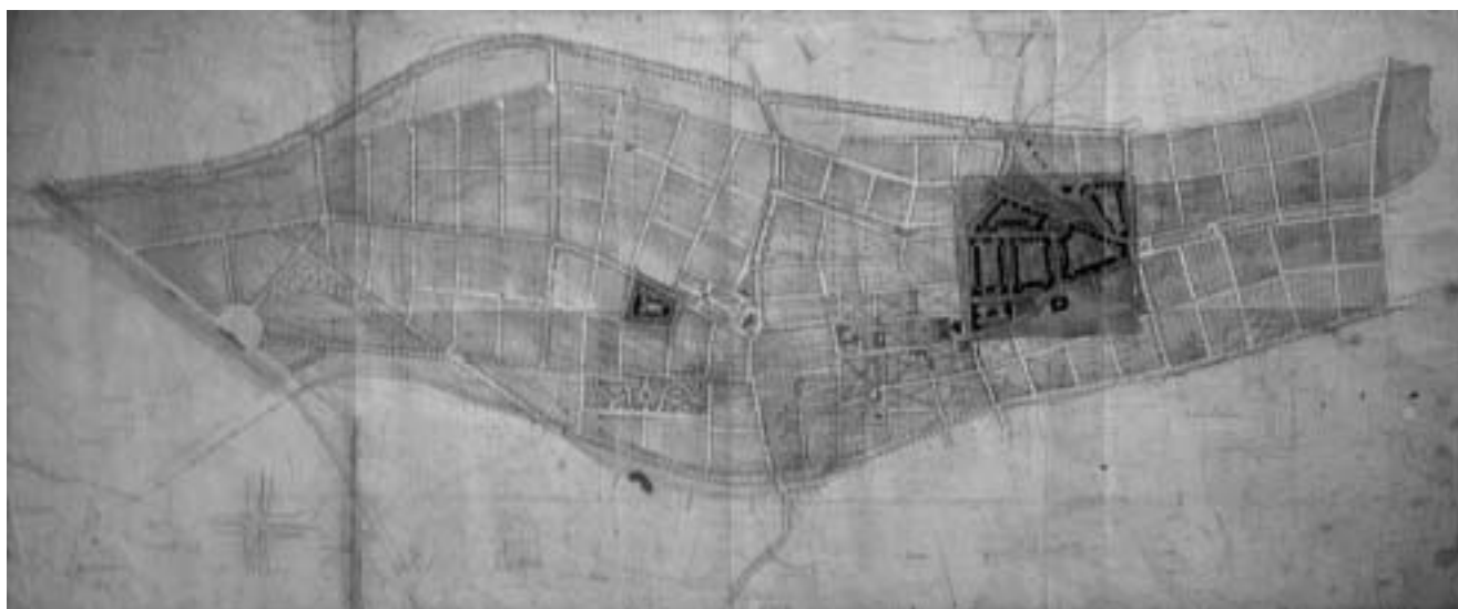
Križevci, Regulatorni nacrt, poslije 1900.

Uprava za katastar i geodetske poslove, Križevci