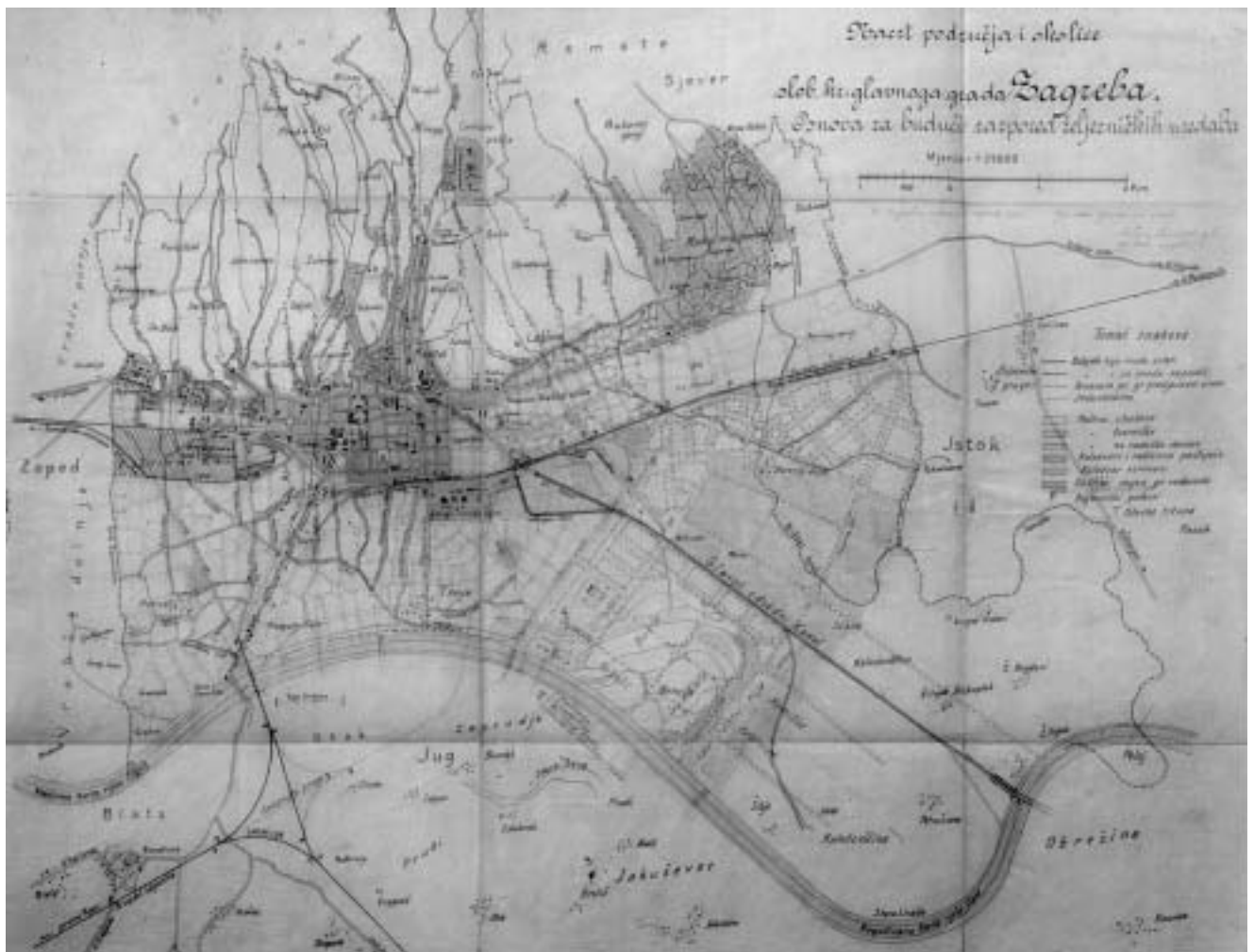
Zagreb, Skica regulatorne osnove, Milan Lenuci, 1907. Državni arhiv u Zagrebu, Zbirka građevinske dokumentacije, 58 Novo rezidencijalno područje južno od poteza željezničkih pruga gotovo je trostruko veće od urbaniziranoga, a površinom ga nadmašuje industrijska zona na istoku (zdesna). Ona sadrži veliko radničko naselje (sa sjevera), područje za vrtove, sajmište, skladišta, tvornice (posebno za »kemičke tvornice«) te luku u mrtvom rukavcu Save (dolje, zdesna). »Nečiste« tvornice smještene su na južnoj obali Save.