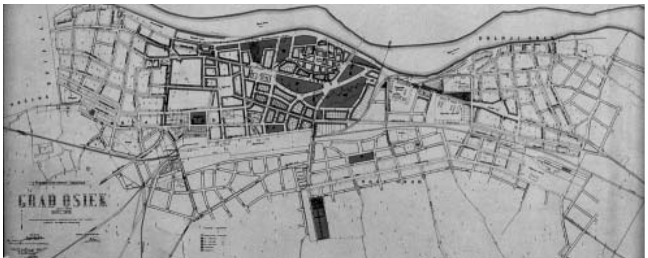
Osijek, Regulatorna osnova, Skender Kovačević, 1911. Muzej Slavonije, Osijek, inv. br. 315 Slijeva Gornji grad, u sredini Tvrdja, zdesna Donji grad. Željeznička pruga s kolodvorom barijera je za proširenje Gornjega i Donjega grada. Dolje zdesna Novi grad i njegovo razvojno područje. Longitudinalan oblik određuje pozicija Gornjega i Donjega grada, formiranih daleko od Tvrdje zbog vojnih razloga te trasa pruge i lokacija kolodvora.