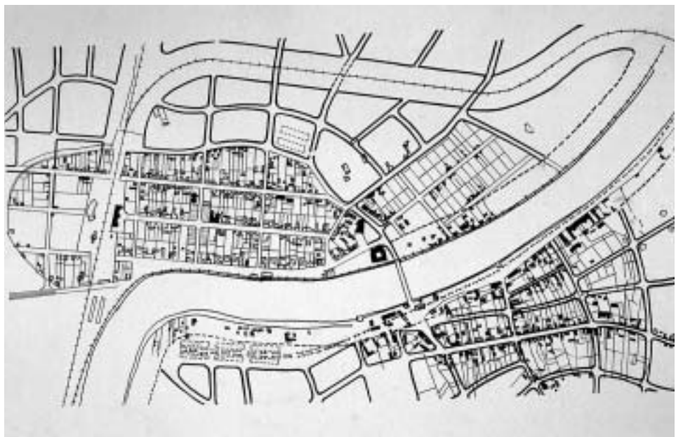
Sisak, Regulatorna osnova, Lavoslav Hanzlowsky, 1909. Muzej grada Siska Plan pokazuje situaciju grada razdijeljenoga kolodvorom, regulira bivši Vojni Sisak (gore) te utvrđuje industrijsku zonu na njegovoj strani. Željeznička pruga opasuje grad.

Unutar elipse planirano je 10 ulica i 252 kuće. Prva ulica sa strane Kupe zadržava tok glavne gradske ulice, druga, najduža, u osi je sjevernih gradskih vrata Siscije; središnja poprečna ulica u osi je istočnih vrata; trg je orijentiran poprečno unutar elipse, u smjeru istok-zapad. Izvan elipse regulirano je predgrađe Vrbina. Vojni Sisak nije bio predmetom regulacije.