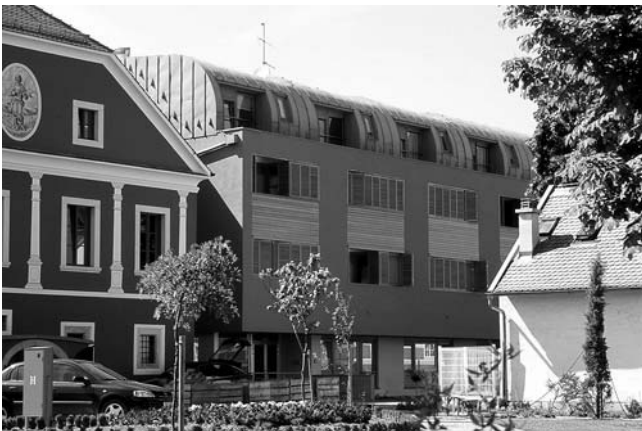
3. Zagreb, Kaptol 7, pogled na interpoliranu zgradu svećeničkog mirovnog doma