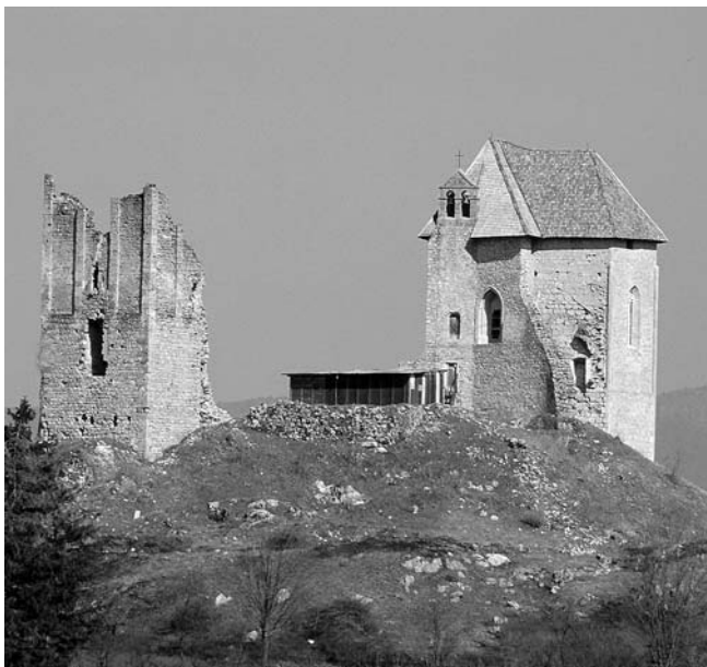
10. Brinje, pogled sa zapada na Sokolac