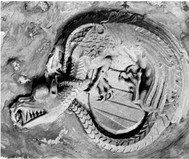
6. Valpovo, reljef u tjemenu svoda prvoga kata okrugle kule