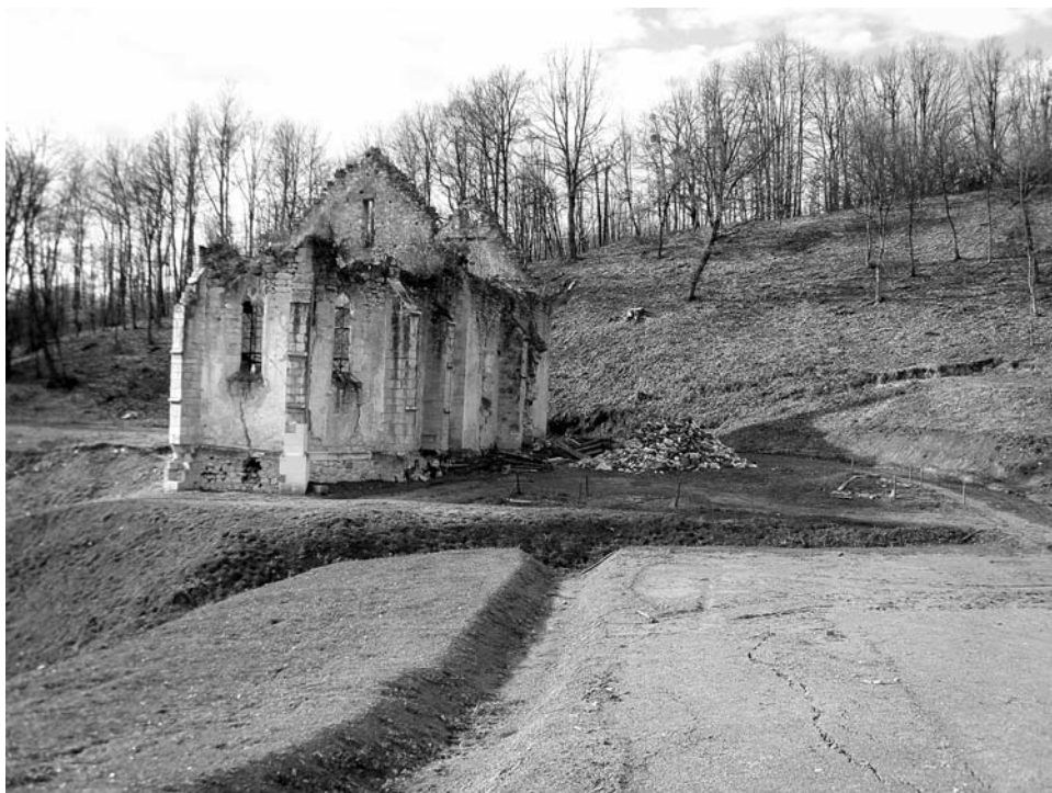
15. Zrin, kapela Sv. Marije Magdalene, pogled s istoka nakon probijanja pristupnog puta i raščišćavanja okoliša (HV)