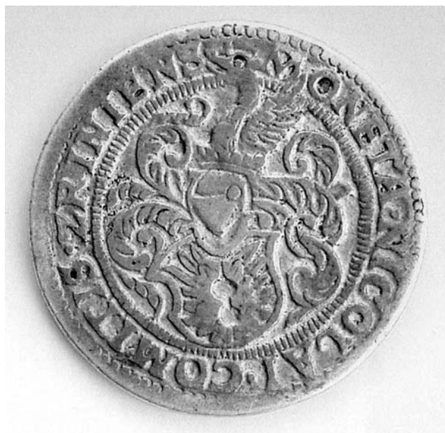
19. Široki groši