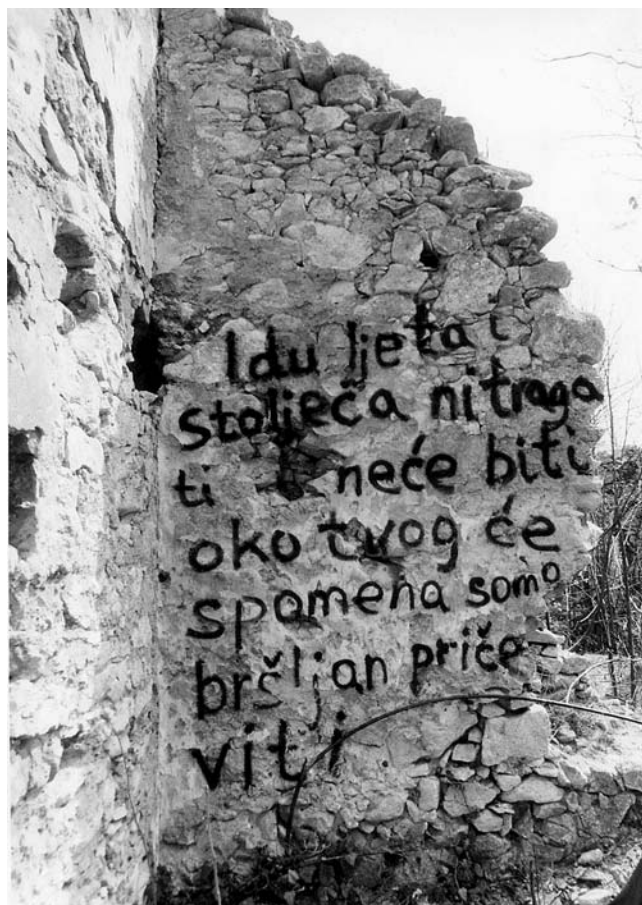
21. Milengrad, stihovi Ulderika Donadinija ispisani na gradskom zidu