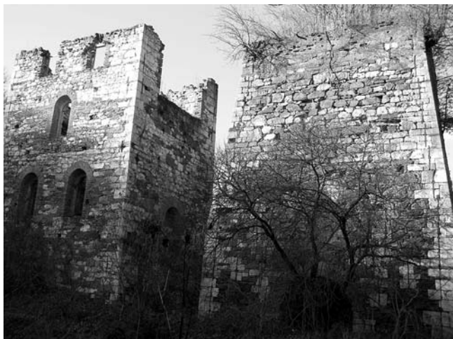
20. Bešlinec kraj Gvozdanskog, pogled na visoku peč (desno) i zgradu za obradu lijeva (lijevo)