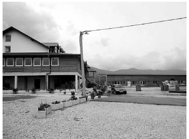
5. Krasno, novoizgrađeni objekti vjerskog turizma