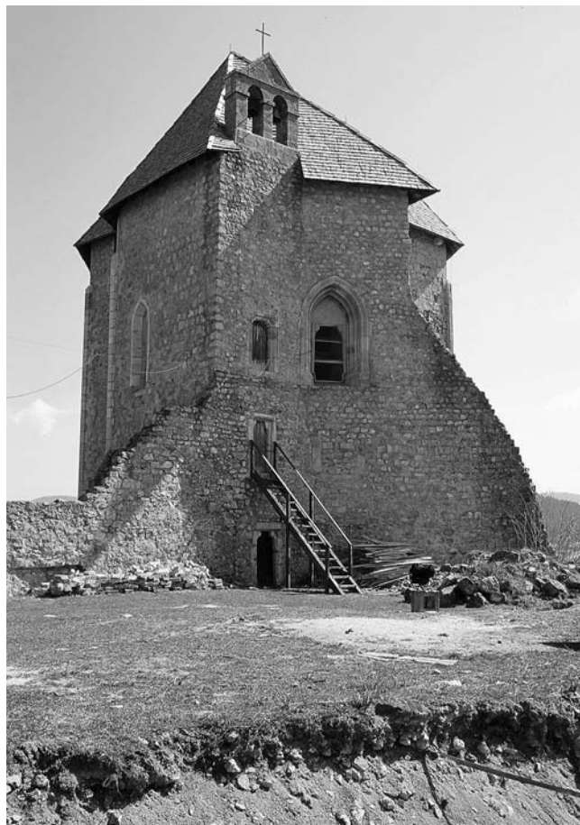
11. Brinje, Sokolac, pogled na zapadno pročelje kapele Sv. Trojstva