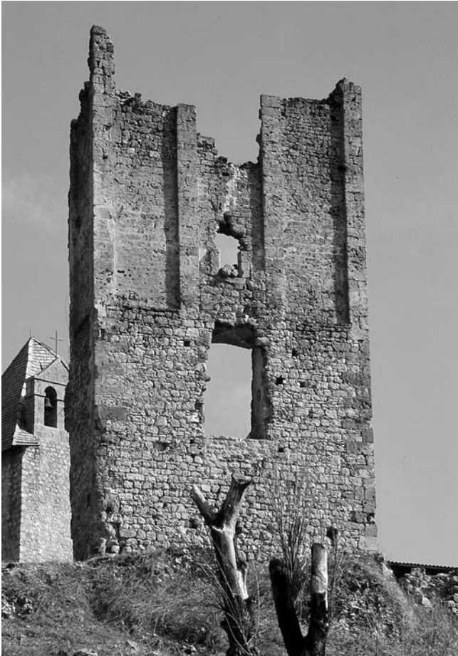
12. Brinje, Sokolac, ulazna kula, pogled sa zapada