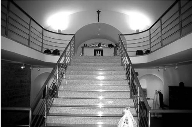
1. Zagreb, Nadbiskupski dvor, pogled s ulaza na unutrašnjost prizemlja ulazne kule nakon adaptacije