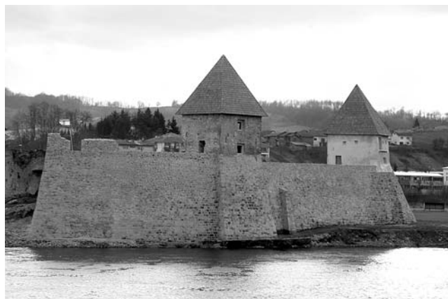
18. Kostajnica, stari grad