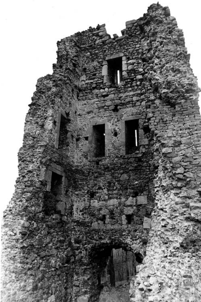
8. Bedemgrad, ulazna kula