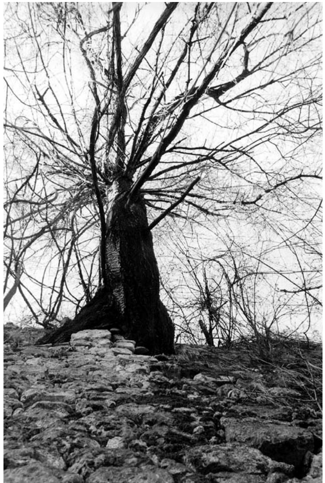
9. Zrin, obrambeni zid