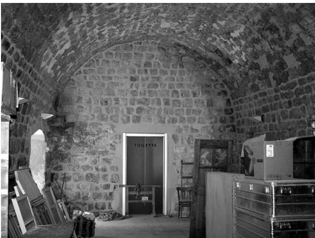
4. Dubrovnik, Ljetnikovac Sorkočević na Lapadu, unutrašnjost orsanana nakon probijanja vrata u vodospremnici