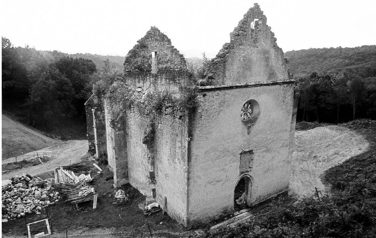
16. Zrin, pogled sa zapada na glavno pročelje kapele Sv. Marije Magdalene