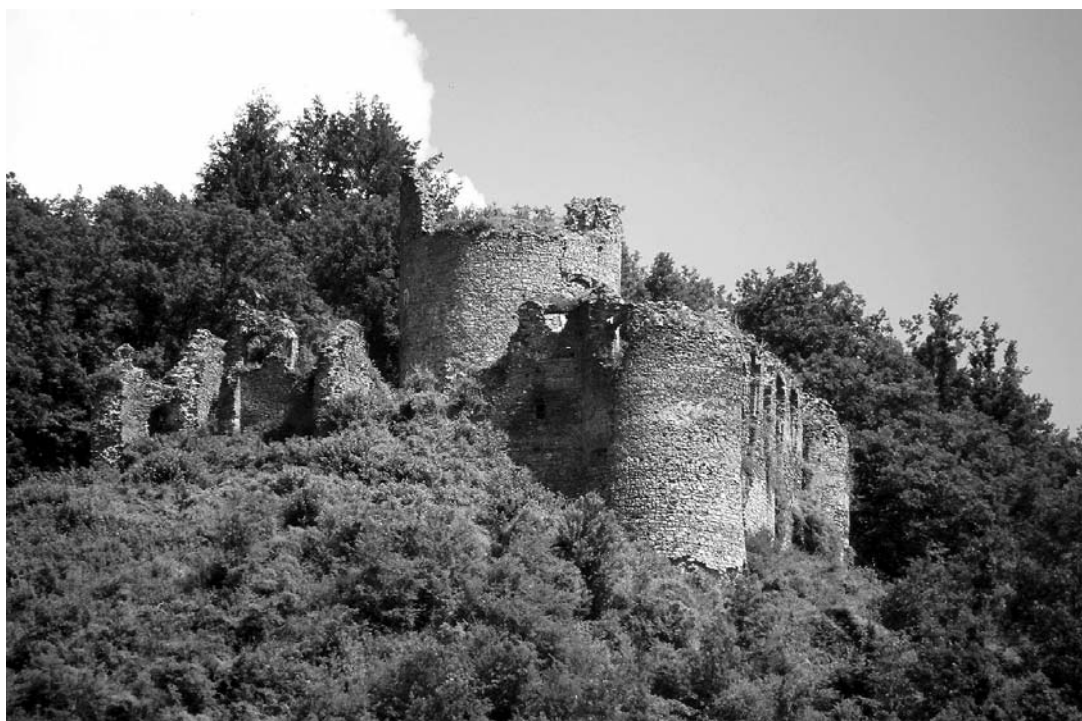
13. Gvozdansko, pogled na kaštel sa ceste Glina-Dvor