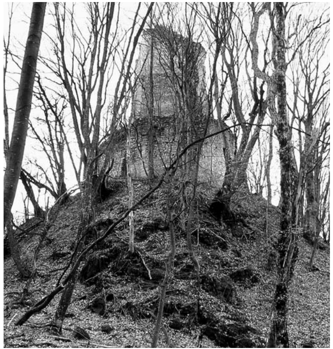
7. Čaklovac, ruševine plemićkog grada