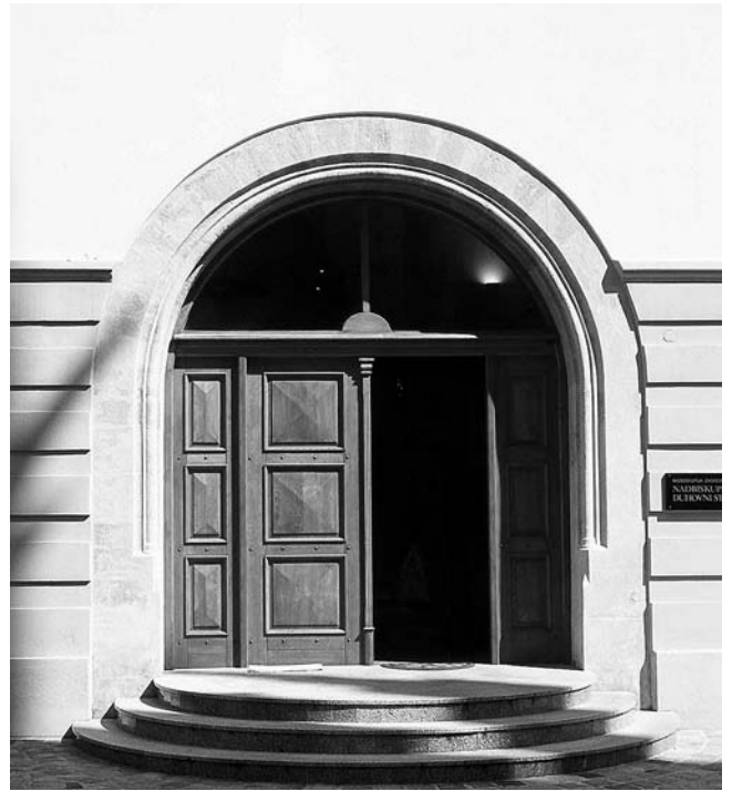
2. Zagreb, Nadbiskupski dvor, pogled na unutarnja vrata nekadašnje ulazne kule nakon adaptacije