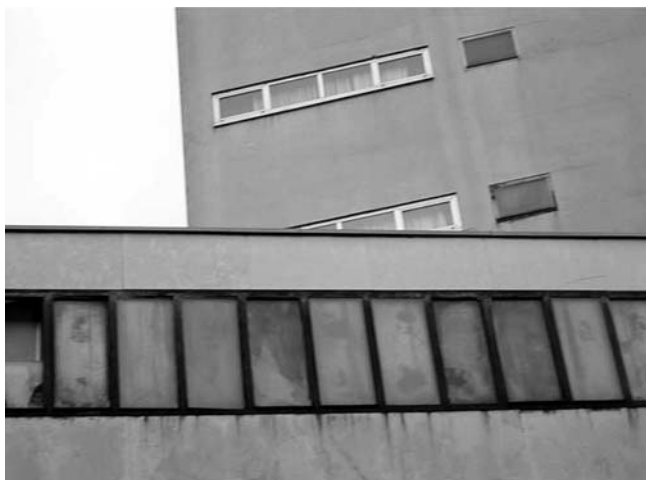
6. Hotel Neboder, Strossmayerova ulica 1, Rijeka, detalji pročelja (obnovljena i neobnovljena bravarija prozora)