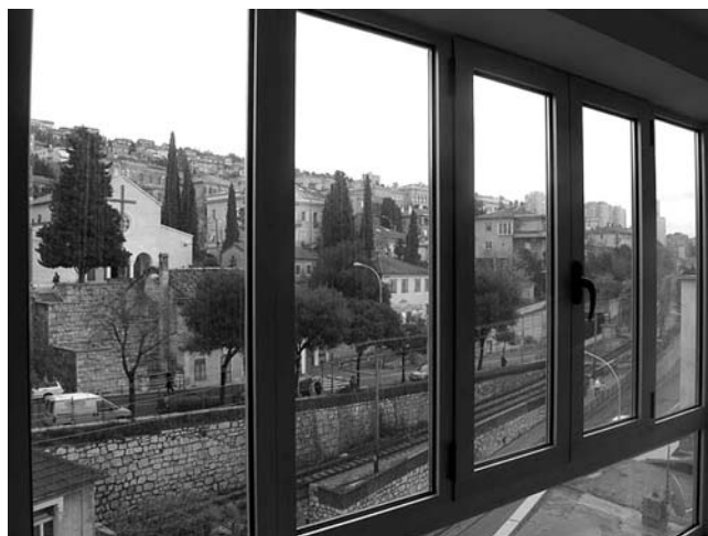
5. Hotel Neboder, Strossmayerova ulica 1, Rijeka, peterokrilni prozor stepeništa (aluminijska bravarija)