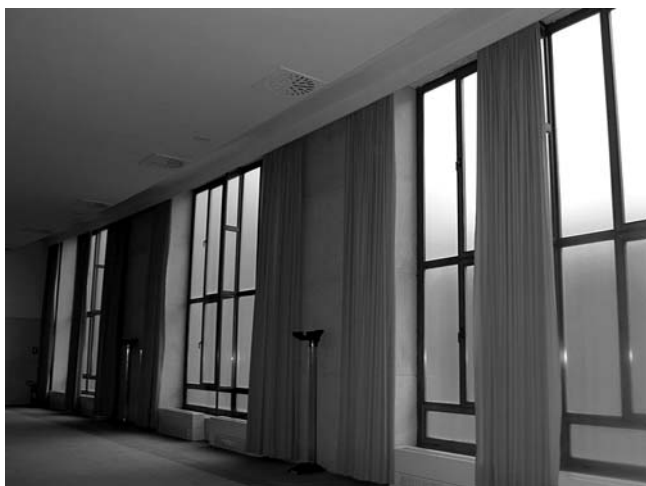
4. Hrvatski kulturni dom, Strossmayerova ulica 1, Rijeka, ophodni hodnik oko velike dvorane s aluminijskom prozorskom bravarijom i novim tapisonom na podu