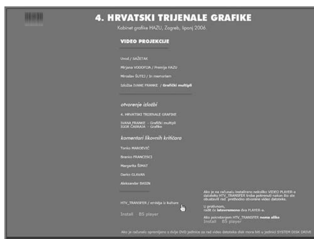
Četvrti hrvatski trijenale grafike, multimedijski interaktivni CD, Kabinet grafike HAZU