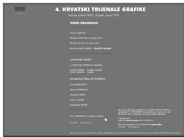
Četvrti hrvatski trijenale grafike, multimedijski interaktivni CD, Kabinet grafike HAZU