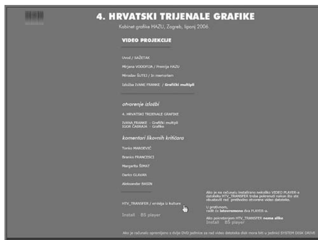
Četvrti hrvatski trijenale grafike, multimedijski interaktivni CD, Kabinet grafike HAZU