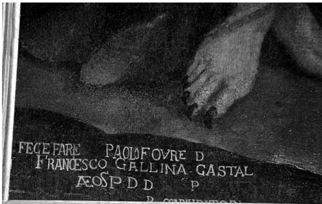
5. Kopar, Crkva Sv. Nikole, Vrag u liku žene nudi hodočasticima ulje što gori u vodi i na kamenju (detalj), Majstor funtanske pale i radionica (?), 1620. (?)