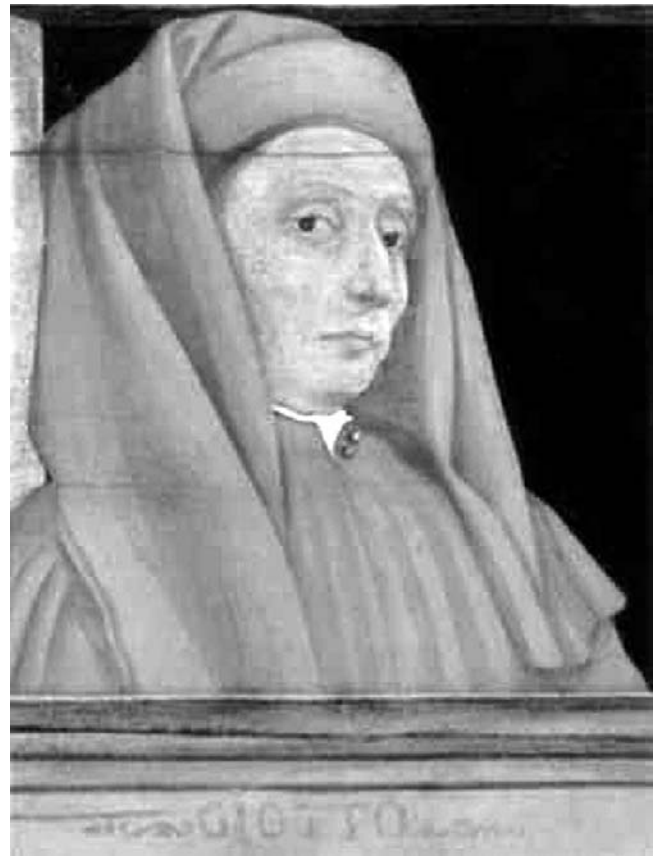
Paolo Ucello, Portret Giotta

On the eastern façade of the lighthouse constructed in 1871 at Jadrija near Šibenik, there is an in-built stone head – a life-size portrait. The author has attributed it to Juraj Dalmatinac, portrait sculptor from the early Renaissance period and author of the frieze consisting of 71 human heads at the Šibenik cathedral. This portrait belongs to the series of individualized portraits of the »common man« made by Juraj Dalmatinac. The portrait has been analysed and compared with his other psychological portraits, characterized by particular types of faces, hats, or hairstyles. In the mid-19 th century, 14 heads were substituted by new ones. On the southern apse, which bears 15 heads, the eighth head was substituted (counting from the left or from the south), which has now been associated with the portrait attributed to Juraj Dalmatinac.