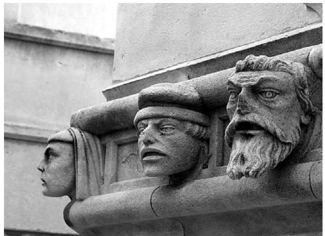
Šibenska katedrala, Juraj Dalmatinac, friz glava