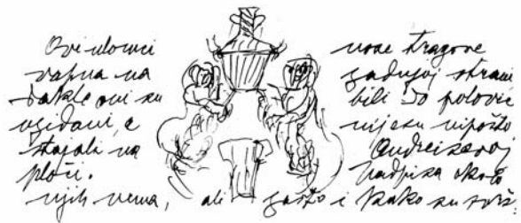
Crtež Roka Slade-Šilovića s prikazom anđela nađenih u grobu u crkvi Sv. Ivana Krstitelja u Trogiru