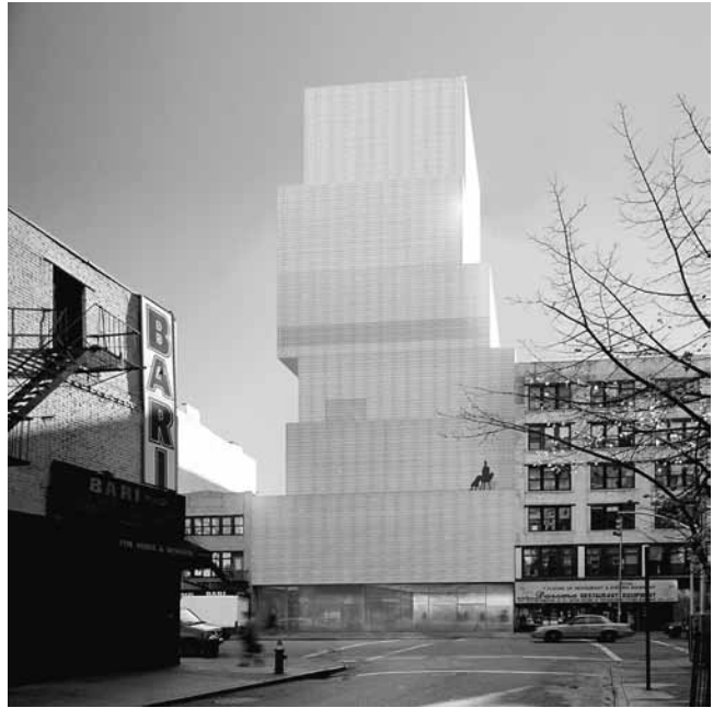
1. SANAA (Kazuyo Sejima, Ryue Nishizawa), Novi muzej suvremene umjetnosti/New Museum of Contemporary Art, Bowery, New York, maketa, 2004. – 2007.