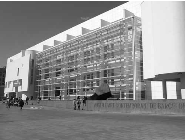
9. Richard Meier, Muzej suvremene umjetnosti, Barcelona, 1987. – 1995.