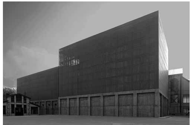
7. EMRE AROLAT arhitekti, Muzej suvremene umjetnosti Santralistanbul, Istanbul, 2006.