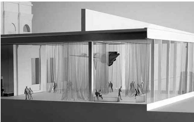
6. Rem Koolhaas, Reinier de Graaf, Office for Metropolitan Architecture/OMA, Muzej suvremene umjetnosti, Riga, 2007. – 2011.