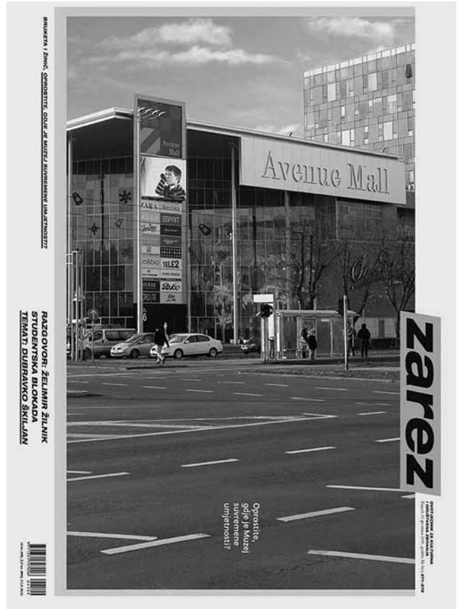
10. Bruketa i Žinić, naslovnica dvotjednika »Zarez« od 10. XII. 2009.