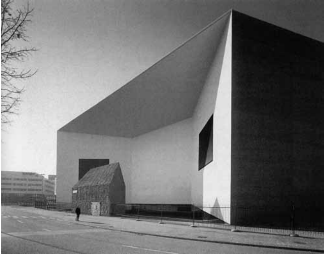
3. Herzog&De Meuron, Shaulager, Depadansa Muzeja suvremene umjetnosti, Basel, 2003.