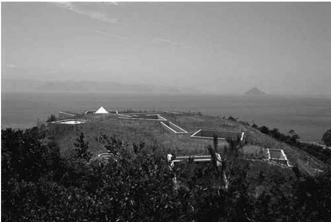
4. Tadao Ando, Muzej suvremene umjetnosti Naoshima, podzemni aneks Chichu (jap. »muzej umjetnosti u zemlji«), 1995.