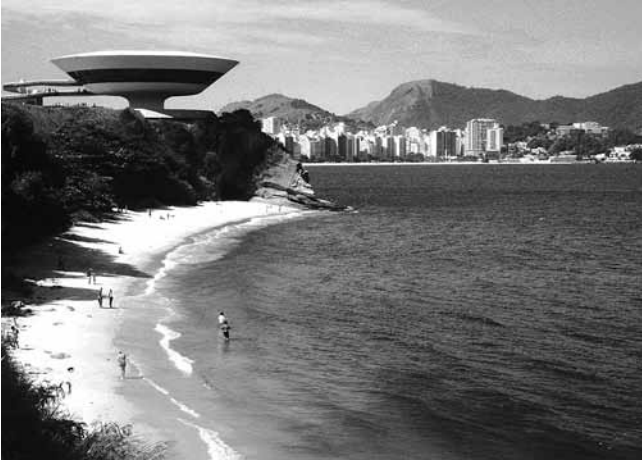
8. Oscar Niemeyer u suradnji s Brunom Contarinijem, Muzej suvremene umjetnosti/Museu de Arte Contemporânea de Niterói, Rio de Janeiro, 1996.