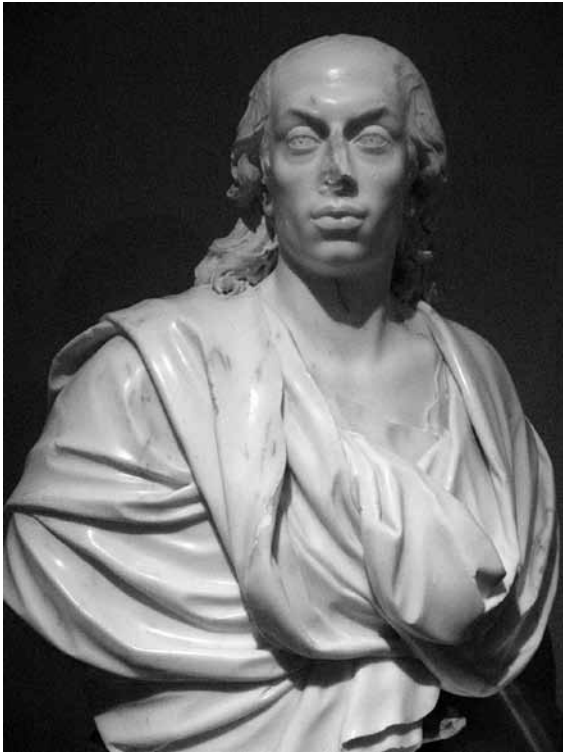
8. Pierre-Etienne Monnot, Livio I. knez Odescalchi , kraj 17. st. (Muzej grada Iloka)