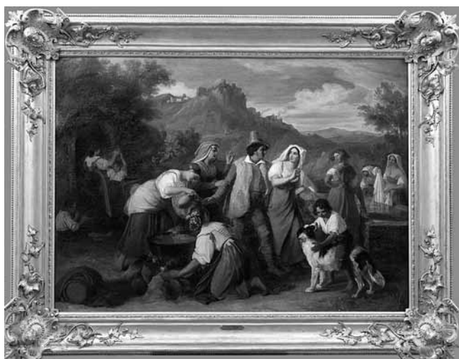
4. Carl Rahl, Rebeka i Eleazar na vrelu , 1857. (Galerija likovnih umjetnosti, Osijek)