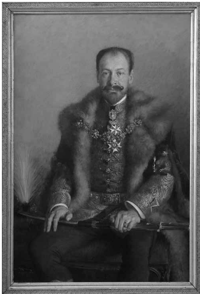
2. Vlaho Bukovac, Teodor Pejačević , 1903. (Galerija likovnih umjetnosti, Osijek)