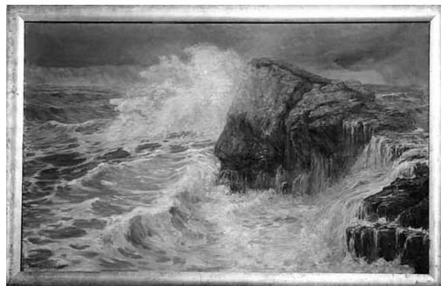
5. Menci Clement Crmčić, Bura na moru , 1908. – 1910. (Galerija likovnih umjetnosti, Osijek)