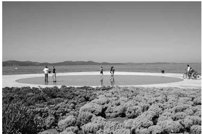
2. Nikola Bašić, Pozdrav Suncu , Zadar, 2008.